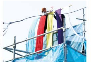
2月10日C様邸上棟式にて。