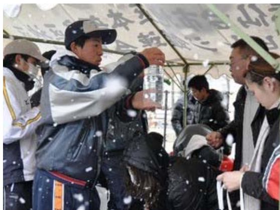
震災直後、給水所でボランティア活動をする野球部員