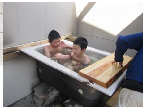
■廃棄の浴槽で“五右衛門風呂”