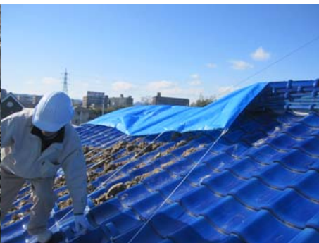
■ブルーシート掛け