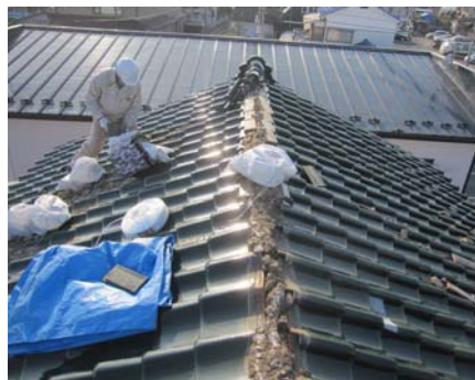
■瓦屋根の応急処置