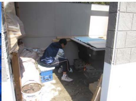
■廃材を薪の代わりに