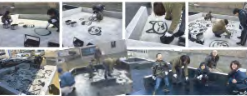
完成——(ノωノ) お疲れ様でした!

最後には黒く塗りつぶしてしまうのですが、家族の胸の中には一生残っていて欲しいな~と思います。今後もおうちづくりの過程で、どんどん呼び出しますが(笑)どうぞよろしくお願致します!!